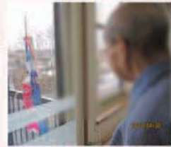
小さいですが鯉のぼりが泳ぎだしました