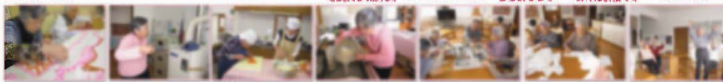
4月のカレンダーを皆さんで作成 ハンドモップ掛け 真剣に包丁を使う... 丁寧に米とごはんをさげる... もやしの茹取り... 洗濯物畳みをされる... 毎日欠かさずラジオ体操