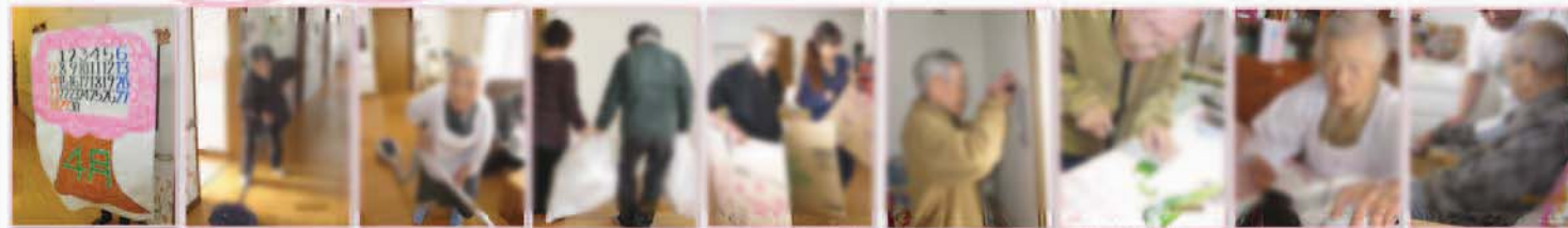
千切り絵で作った4月のカレンダー モップ掛け 掃除機掛け ゴミ捨て... さんはこまめな仕事... 男性も料理作りのお手伝い... 何でもできる... 血圧測定は毎朝...