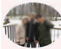
4月26日 水芭蕉の下見に行くとき雪がこんなに積もっていました