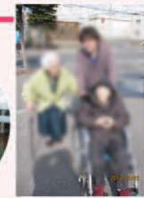
天気の良い日 散歩を開始しました

花の周りは、少しずつですが春の風景が見られるようになってきました。散歩が始まり、鯉のぼりが泳ぎ、あとは花が咲くのを待つばかり!